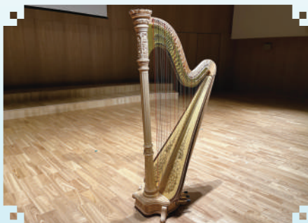
AOYAMA Harp 47C EX Musa (明和会寄贈)