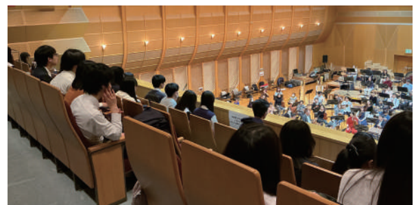
名古屋フィルハーモニー交響楽団 リハーサル見学