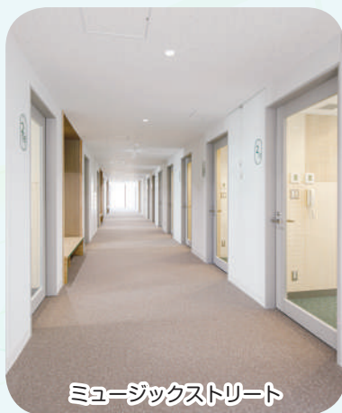
ミュージックストリート