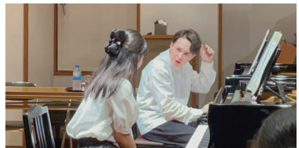
ロー 磨秀(ピアニスト)