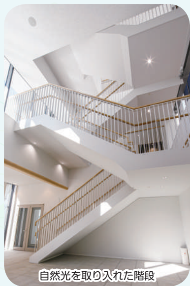
自然光を取り入れた階段

令和8年4月より、新音楽棟での授業が始まりました。 「響きスパイラル」を基本コンセプトに、音楽で溢れる空間となっています。