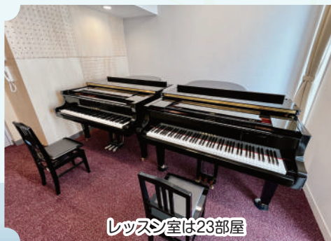
レッスン室は23部屋