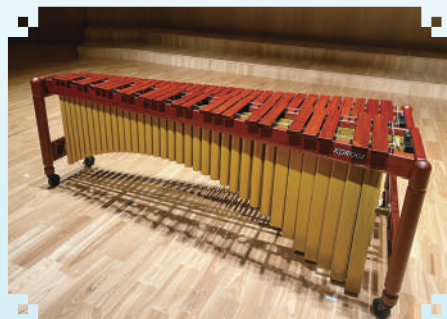
KOROGI Marimba PF3000CC