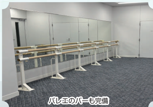
バレエのバーも完備