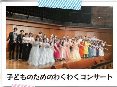
子どものためのわくわくコンサート